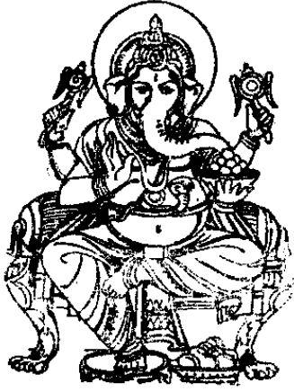
శ్రీ మహాగణపతయే నమః