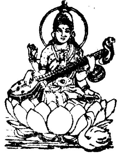
శ్రీ సరస్వత్యై నమః